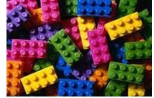
"Workshoplets: Fórmula de Aprendizaje a la medida y justo a Tiempo"