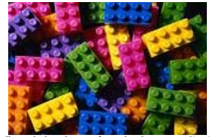
“Workshoplets: Fórmula de Aprendizaje a la medida y justo a Tiempo”